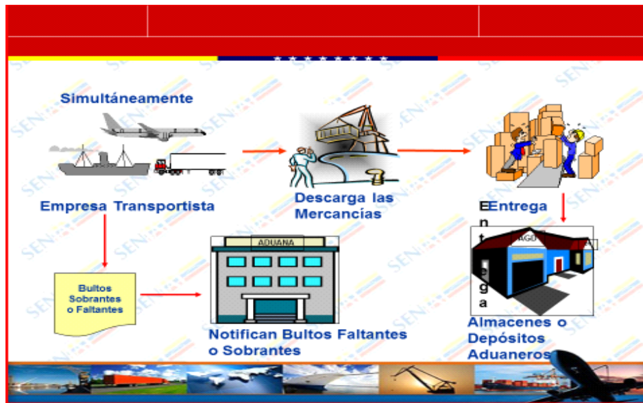
Figura 2. Llegada de la mercancía al territorio aduanero nacional