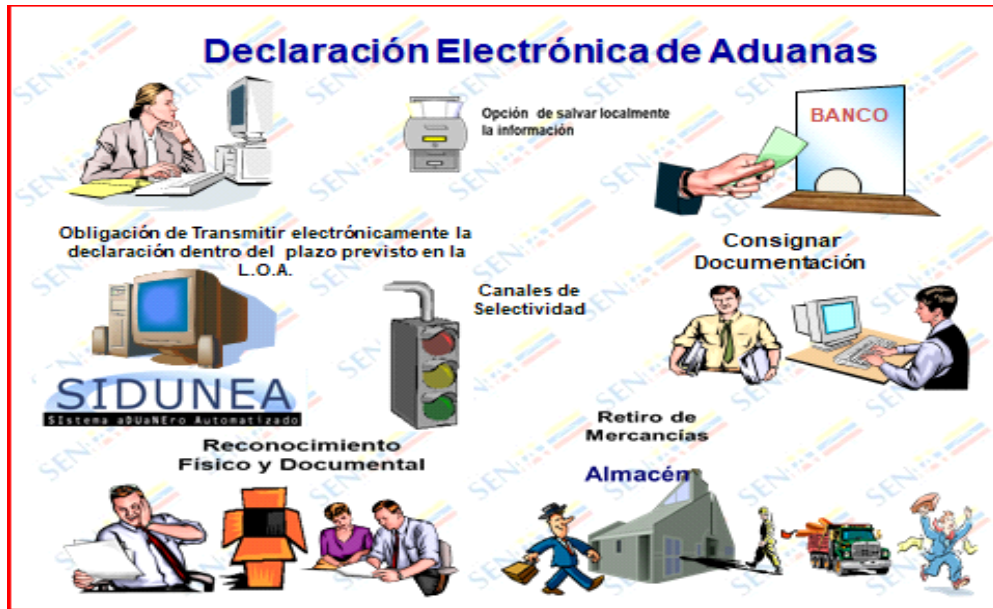
Figura 4: Proceso de nacionalización de mercancías