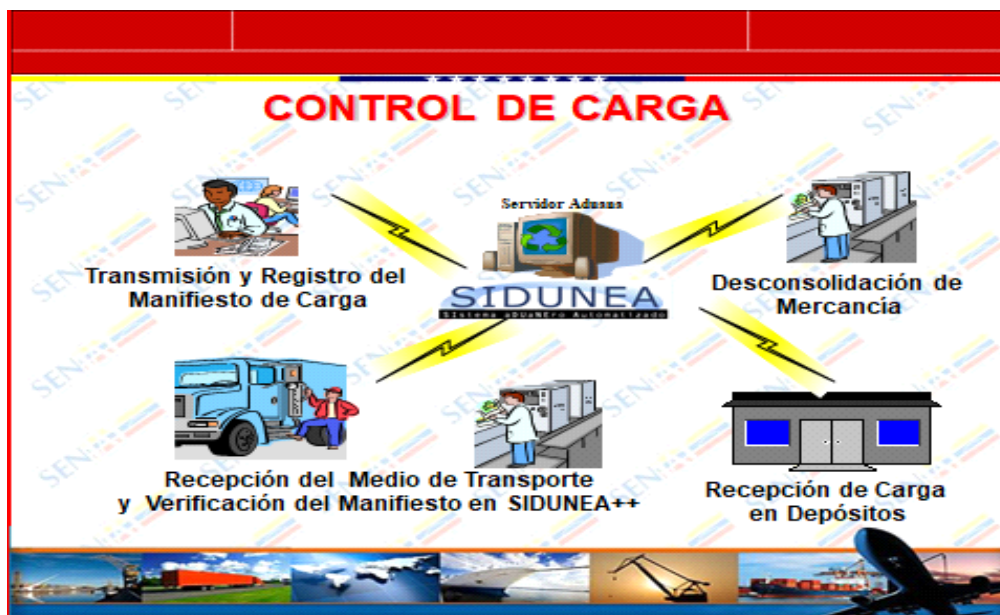
Figura 3. Procedimiento de control de carga

Una vez que la mercancía ingresa al territorio aduanero nacional de acuerdo a lo establecido en el artículo 20 de la LOA, se debe realizar lo siguiente: