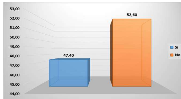
Gráficos N° 03 Procedimiento para el aumento de capital