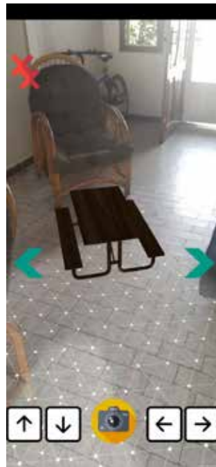
Figura 5, Vista de Catalogo.