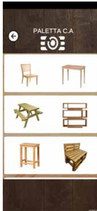
Figura 6, Vista de Cámara.