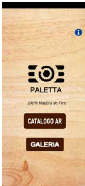
Figura 4, Vista de Galería.