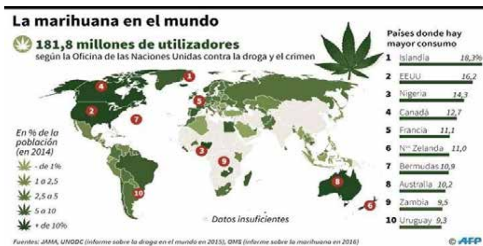
Figura 1. Uso de cannabis (marihuana) en el mundo

En la Figura 1 se muestra el uso de cannabis a nivel mundial donde Canadá ocupa el cuarto sitio.