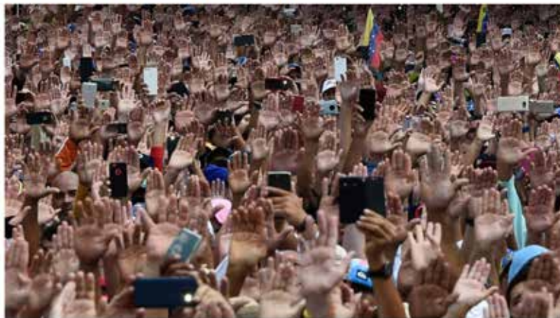
28/01/2019 | (PHOTO BY FEDERICO PARRA / AFP) EL ESTÍMULO @elestimulo