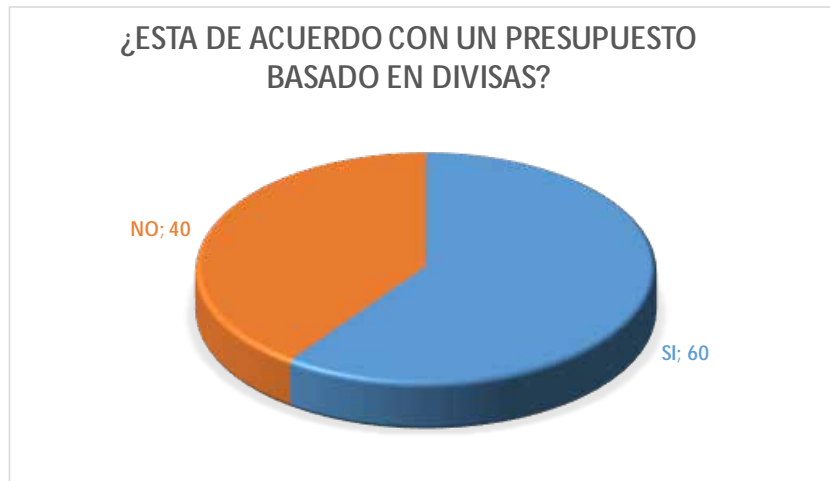
Gráfico: N° 07