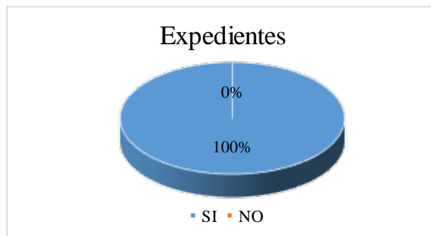
Grafica N° 9