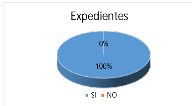
Grafica N° 6