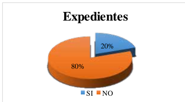
Grafica N° 8