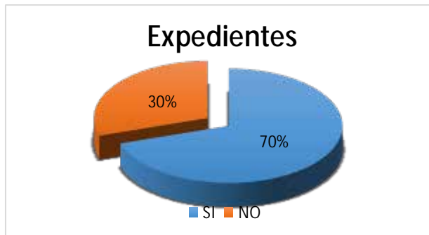
Grafica N° 2