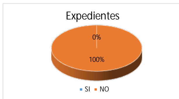
Gráfica N° 7