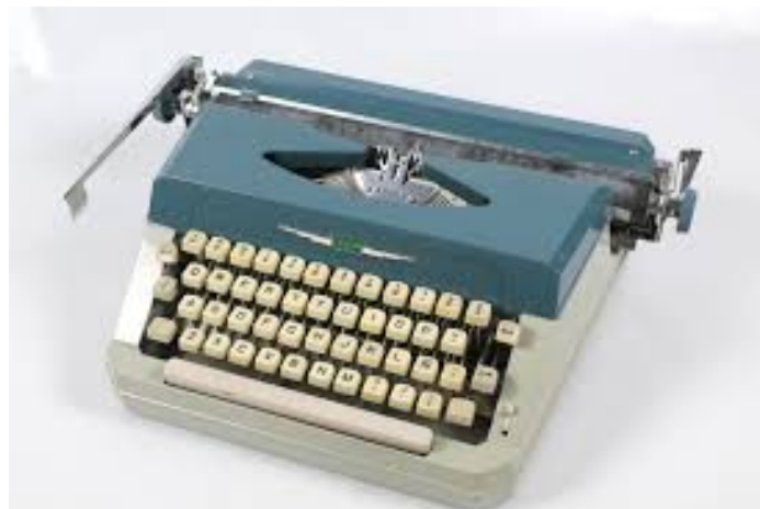
La máquina de escribir que se usaba antes del computador

transformaciones económicas, sociales y tecnológicas, así también podrían adaptarse a los cambios actuales que emergen en el seno de las sociedades globalizadas, y a las ventajas competitivas que ofrecen la aplicación de las tecnologías de la información y la comunicación, que para la época de la industrialización en Venezuela, no se contaba con estas herramientas, en aquel entonces el uso de los computadores no era tan frecuente como ahora, no se contaba con internet ni todas las tecnologías que esta misma ofrece, era más usual el uso de los fax, el teléfono local, y las máquinas de escribir, pese a que en la industrialización en Venezuela, fue una transformación lenta, la aparición de los computadores y sus usos, tanto en la empresa como en los hogares, comenzó a popularizarse, ya para la época de los 90, algunas empresas contaban con herramientas tecnológicas acordes a la época, como los primeros computadores monocromáticos, algunas de las PYMES de aquel momento, tenían la posibilidad también de invertir en estas fuentes tecnológicas, y de adaptarse a los cambios, ya en el año 2000 en nuestro país, muchísimas organizaciones usaban los correos electrónicos e internet para comunicarse, y muchas otras ya habían invertido en computadores que les permitían agilizar sus procesos de negocios.