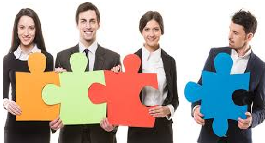
La Dirección por Objetivos

Muchas transnacionales en la actualidad usan la dirección por objetivos, como parte de sus planificaciones estratégicas, de manera que los objetivos de los colaboradores se alineen con los objetivos de la empresa, y a la final una orientación importante para los gerentes modernos de las PYMES, y parte de la ventaja de establecer buenos objetivos para la empresa es ver cuáles son los objetivos del cliente, y las tecnologías de la información y la comunicación, también deben ser alineadas a esos objetivos.