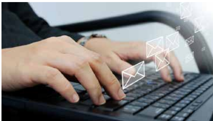
Gerente haciendo uso del correo electrónico

En la actualidad, al igual que las redes sociales, existen muchas aplicaciones de correos electrónicos que las PYMES pueden usar de forma gratuita, sin embargo, para garantizar la seguridad de la información, es relevante pagar por alguna aplicación o software, porque los emails gratuitos a veces presentan muchos problemas como el correo no deseado, las burlas y correos irrelevantes que se envían por internet, los hackers pendientes de las cuentas bancarias de la empresa, los virus informáticos y los hoax .