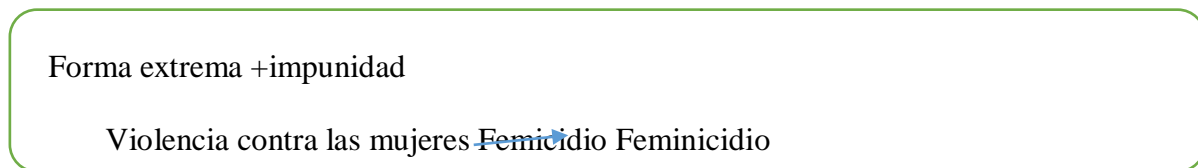
Figura 1. Proceso de delimitación y relación de los conceptos Femicidio/feminicidio

No obstante, Lagarde (2012), menciona por qué transitó de la palabra Femicidio a feminicidio dado que Femicidio en castellano resulta ser la voz homóloga de homicidio el cual solo expresa el homicidio de una mujer, vocablo que no refleja su impunidad. El vocablo impunidad se introduce en el concepto de feminicidio partiendo de la base de Femicidio, donde se puede plantear la existencia de una relación entre ambos conceptos. Relación que se explica por medio de la siguiente representación.