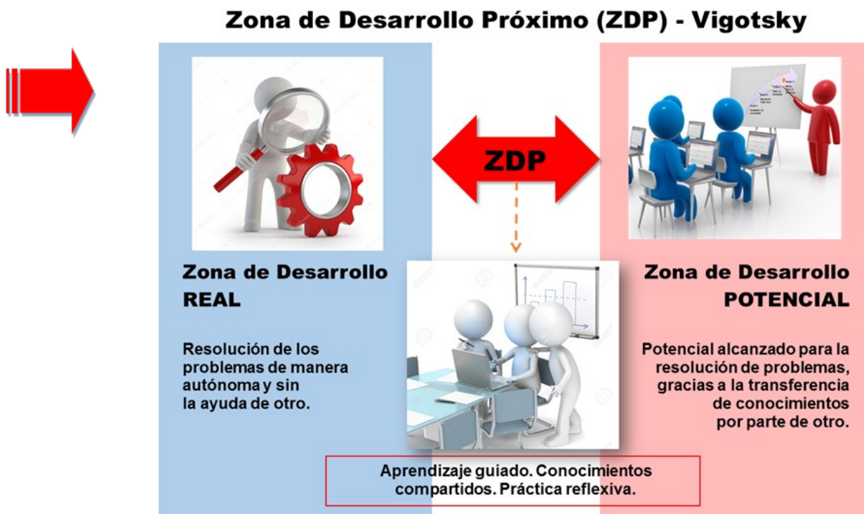
Imagen 1. Zona de Desarrollo Próximo. Aguiar, Enma (2017)

de las características relevante en un buen proceso de aprendizaje. Así mismo, Vygotsky al plantear que para posibilitar el trabajo eficaz como docente debe usarse el concepto de “Zona de Desarrollo Próximo” entendiéndose el mismo como el paso del nivel real de conocimiento a un nivel potencial, tomado de la mano de un individuo que tenga ya ese nivel potencial de conocimientos (ver imagen 1), se estaría cumpliendo con otra característica importante en el proceso de aprendizaje, que es la necesidad de alguien que contribuya al aprendizaje, guiando al aprendiente y brindándole las herramientas necesarias, para que pueda realizar un aprendizaje autónomo llegando al nivel potencial y acceder a los Procesos Psicológicos Superiores. Así mismo el nuevo conocimiento es integrado con otros previos tomados del entorno socio cultural.