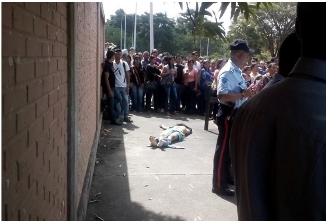
Caso Estudiantes de la Universidad de Oriente